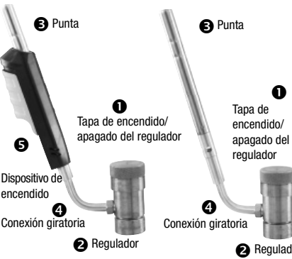
HTS99 - Figura 1